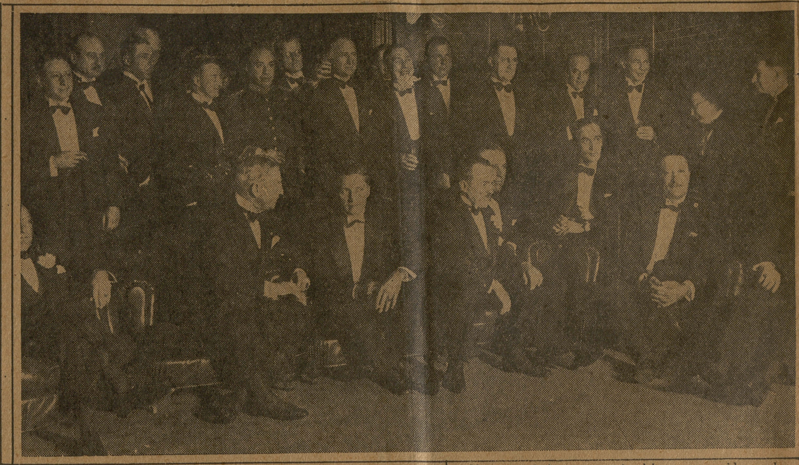
Una parte de la concurrencia al banquete servido anoche en el Club Americano

"De hoy en adelante, una de las calles de Montevideo llevará el nombre del hijo mayor del general Mitre. Es un homenaje justiciero. Bartolito, nacido en Montevideo, quiso mantener, y se mantuvo siempre, ciudadano oriental, a pesar de que una ley lo autorizaba a optar por la ciudadanía de su padre. 'Franja más o franja'—ya menos—dijo alguna vez—, nuestra bandera, uruguayo, es una sola".