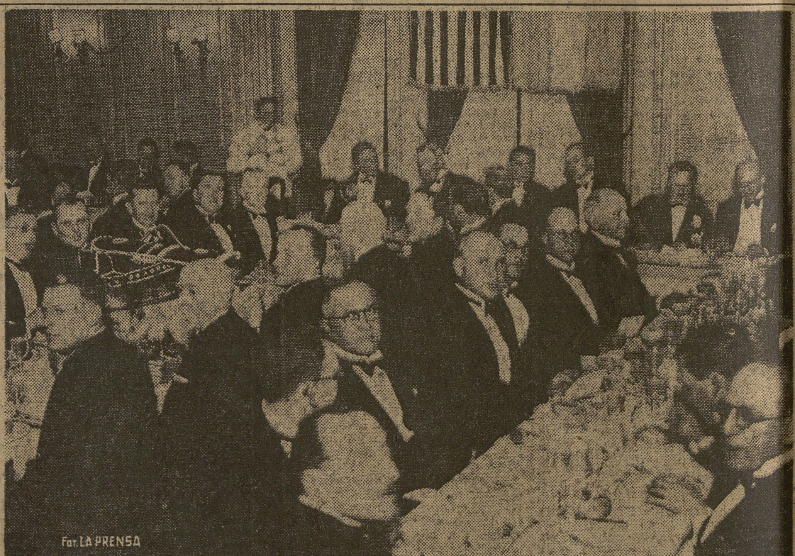
Un aspecto del banquete servido anoche en los salones del American Club

En compañía de esas personas el general Justo penetró en el aparato, en el que permaneció durante largo rato, recibiendo de los funcionarios de la compañía explicaciones detalladas acerca de su funcionamiento y de las innovaciones técnicas introducidas en la construcción de la cabina de pasajeros y compartimento de motores. El Presidente de la Nación quedó satisfecho de su visita, testimoniando a las personas que lo acompañaban la óptima impresión que le había producido el conocimiento de la gigantesca aeronave.