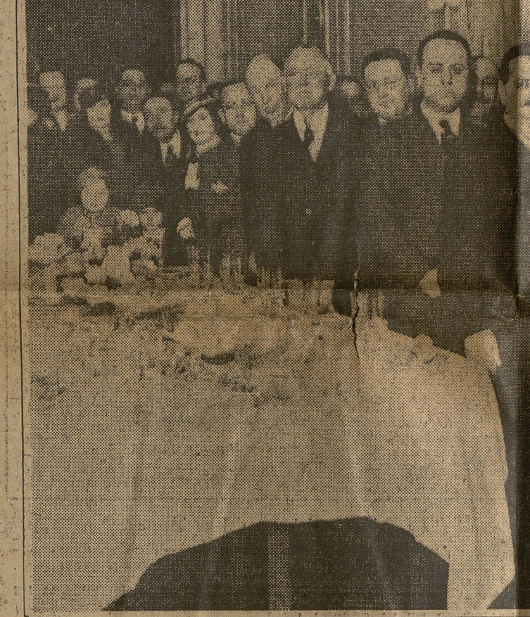
La recepción ofrecida ayer en el Círculo de la Prensa en honor de los periodistas norteamericanos

Poco después de las 13, frente al aeropuerto se reunió una enorme cantidad de público, el que a medida que avanzaban los minutos iba au-