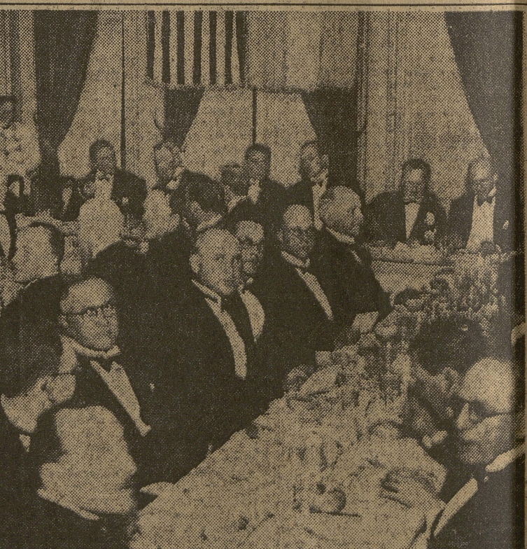
Un aspecto del banquete servido anoche en los salones del American Club